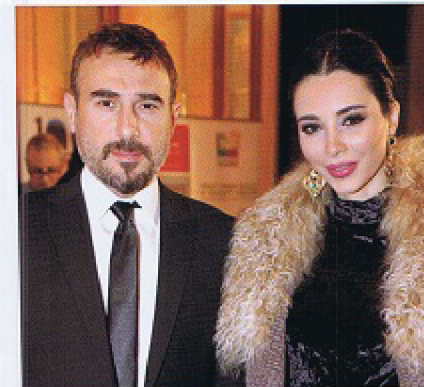
باسم وشيرين مغنية