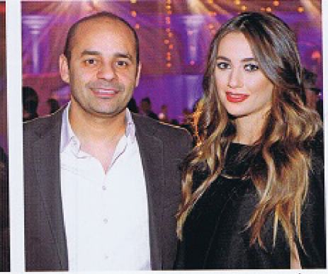
يديع كرم والسبا ستيلان