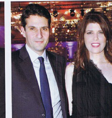
ليكوفا قساطلي واين طحيني