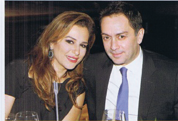
الوزير السابق زياد بارود وعقيلته ليندا